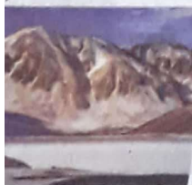
1 ರವೆಗೆ ಮತ್ತೊಬ್ಬರ ಪ್ರವಾಹ ಹೋಗು ರ್ವದ ಒಂದು ಸೆಕೆಂಡ್ ಪ್ಯಾಕೇಜ್.