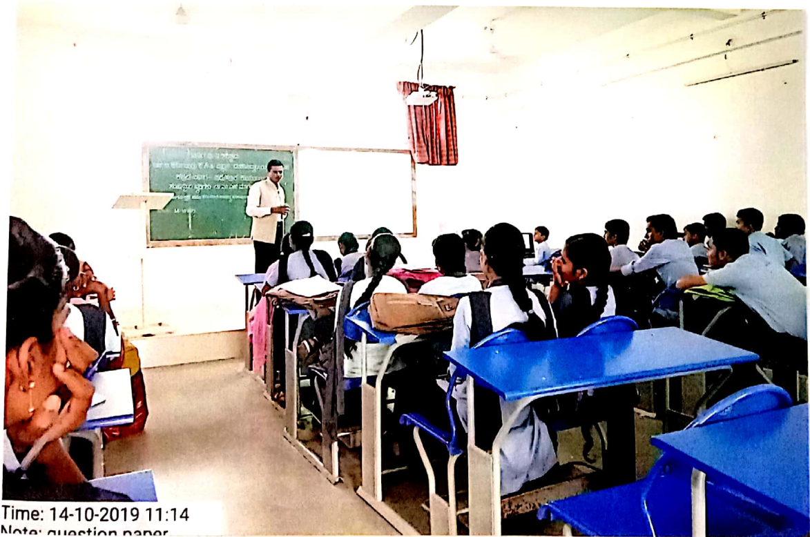
Time: 14-10-2019 11:14 Note: question paper