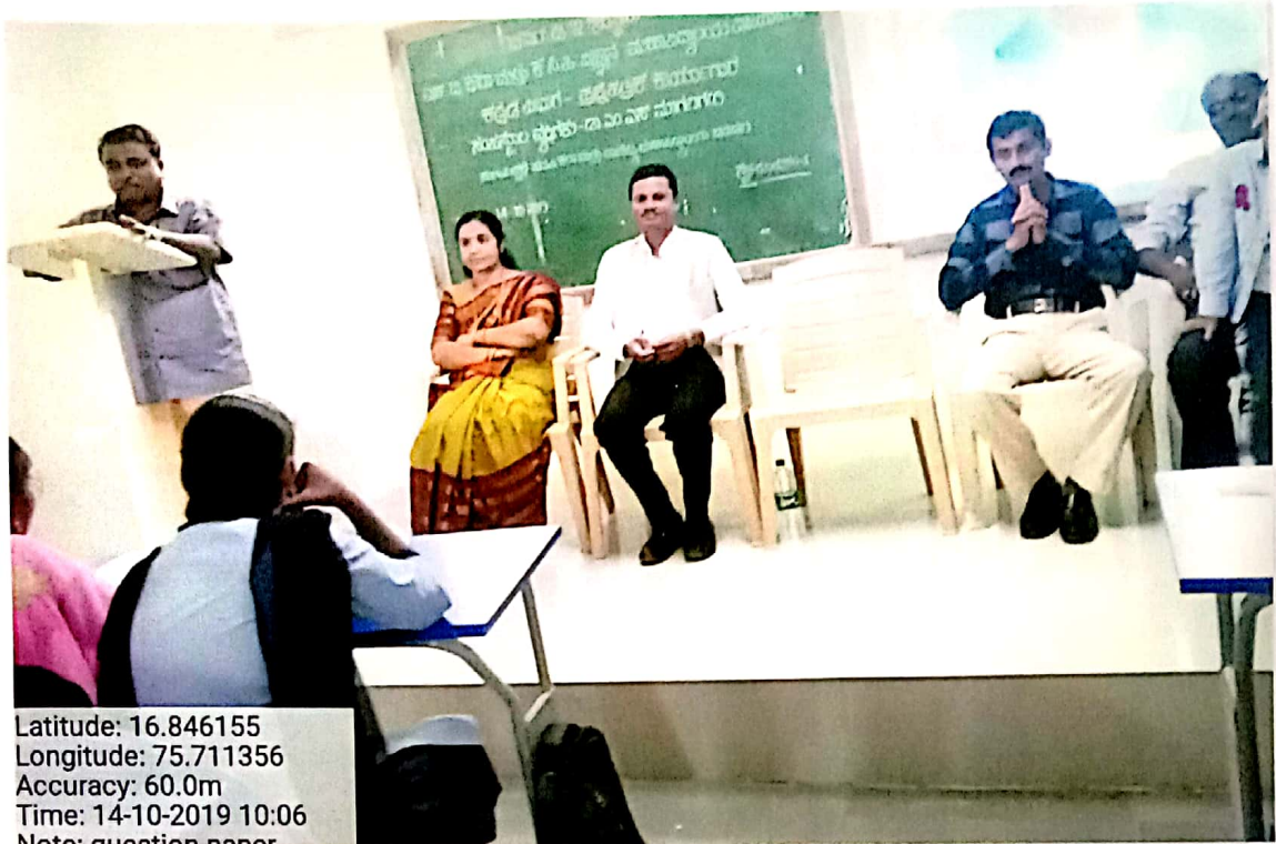
Latitude: 16.846155 Longitude: 75.711356 Accuracy: 60.0m Time: 14-10-2019 10:06 Note: question paper